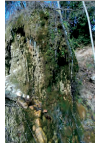
Pequeña cascada en La Fuensanta

Este camino en fuerte descenso nos saca a la antigua carretera y frente a nosotros hay un pequeño aparcamiento y junto a él unas escaleras de cemento que descienden al área recreativa de La Fuensanta, con mesas y asientos. Es un buen lugar de descanso. En uno de los rincones de este paraje hay una cascada tobácea que merece la pena descubrir, y que se surte de un manantial que viene de más arriba.