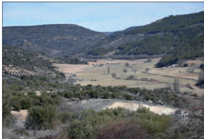
Valle del Ungria

Una vez en el pueblo podemos visitar sus callejuelas, la iglesia parroquial, asomarnos a los miradores o conocer la afamada Ruta de las Bodegas de Horche.