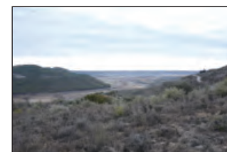
Paisaje de la vega de Horche

Continuaremos nuestro camino para descender por un caminito que nos saca de nuevo a la carretera; seguimos por ella a la derecha. Recomendamos caminar por