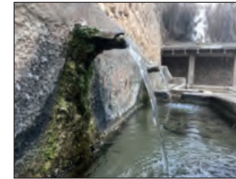
Fuente de la Píllilla

Esta es una ruta sencilla y corta que la podemos hacer en familia con los pequeños de la casa, ya que apenas reviste dificultad.