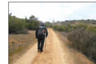
Por el Camino de la Píllilla

Seguimos por un camino en dirección contraria al que hemos traído y que se encuentra a la derecha. Poco después encontramos un camino que desciende rápidamente y que nos sale a la izquierda, continuamos por él.