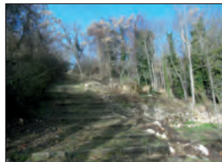
Junto a La Fuensanta

la izquierda y con el chaleco puesto. Apenas tiene tráfico pero recomendamos extremar las precauciones, máxime si se va con niños.