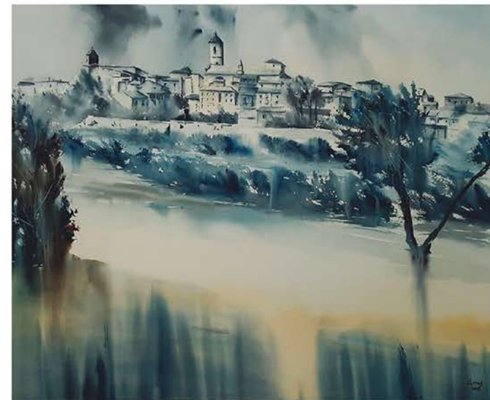
Paisaje lluvioso", Miguel Ángel Rodríguez