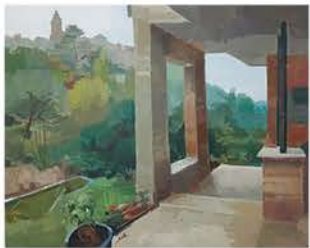
2º Premio: "Desde la casa de Marta", Sergio del Amo